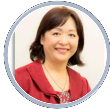
西沢頼母 (にしざわたのも)